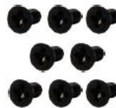
M3x6L Screw * 8