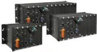
LX-9181 LX-9381 LX-9781

In addition to this guide, the package includes the following items: