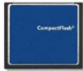
CF 插槽 配一 CF 卡