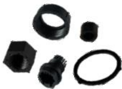
RJ-45 WaterProof Connector