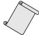
Quick Start (This Document)